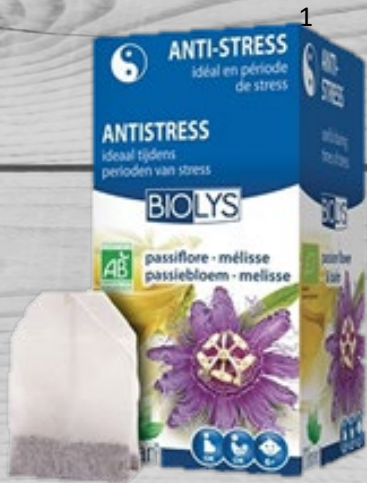
Antistress passion flower tea € 3,90 (excl. VAT) APT 031