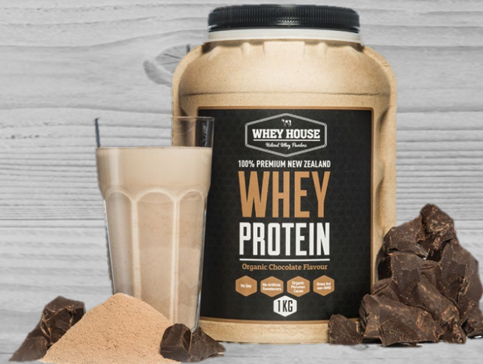
Proteïne shakes choco € 35,00 (excl. BTW) PSC 056