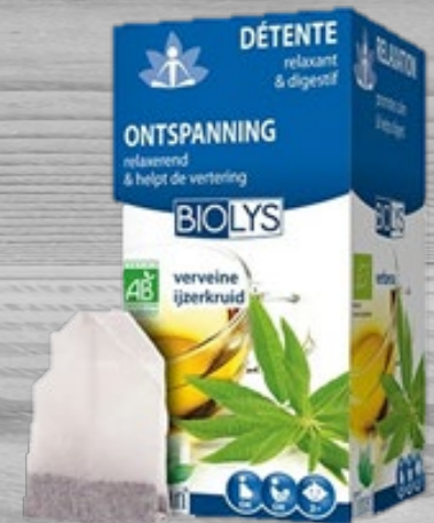
Ontspannings thee ijzerkruid € 4,70 (excl. BTW) OTI 033