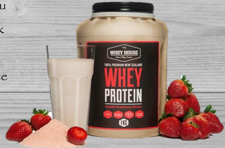
Proteïne shakes aardbei € 35,00 (excl. BTW) PSA 054