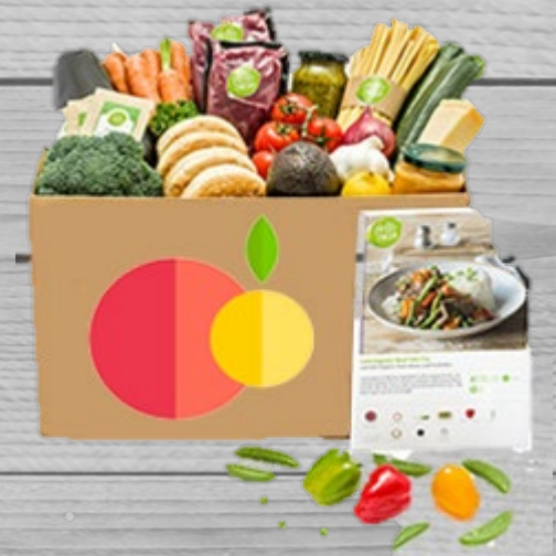
Veggie box tofu € 37,60 (excl. VAT) VBT 003

Tofu easily takes over the taste of other ingredients.