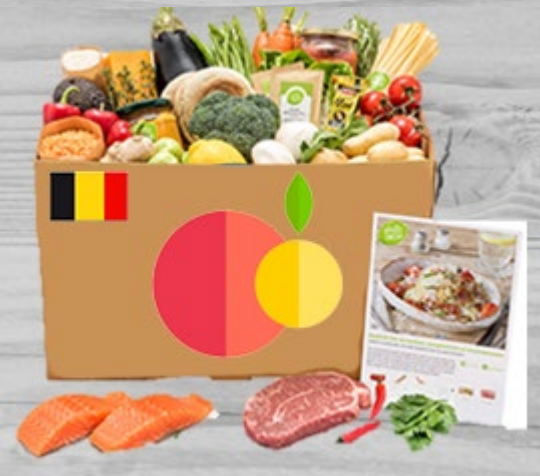
Lunchbox typical Belgian € 33,00 (excl. VAT) TBB 004

Our typical Belgian box is filled with meat, fish and vegetables.