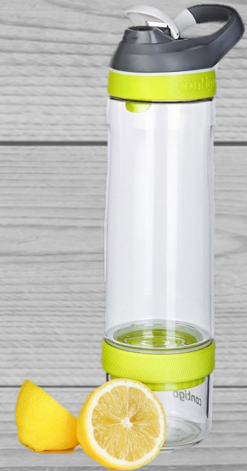
Drinking bottle € 17,00 (excl. VAT) DF 048