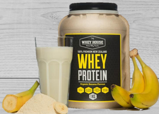
Protein banana shakes € 35,00 (excl. VAT) PSB 055

By drinking protein you will feel and see that it will help a lot when you are working hard.