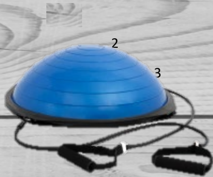
Hastings balance trainer € 79,00 (excl. BTW) HBT 043