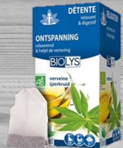
Relaxing tea IronHerb € 4,70 (excl. VAT) OTI 033

Tea that lets you sit down and reflect on the past. If you need 10 minutes of your day just thinking and drifting away then you need to drink this.