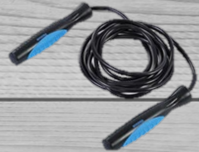
Skipping rope € 9,00 (excl. VAT) HBT 044

With our fine little selection of fitness-equipment you can easily do excercises that can help you be more relaxed after a session.