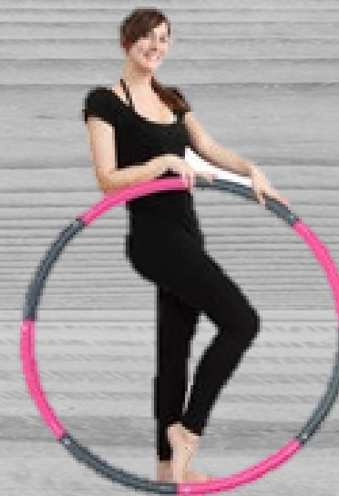
Weight hoop 1,5 kg € 23,00 (excl. BTW) FWH 046