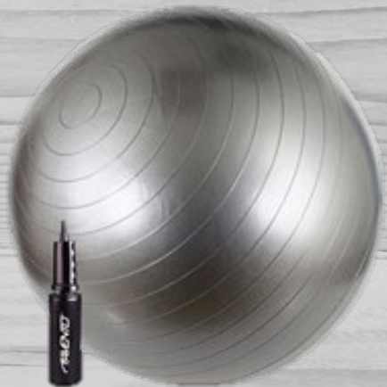
Gym ball € 12,00 (excl. VAT) FGB 045

With our fine little selection of fitness-equipment you can easily do excercises that can help you be more relaxed after a session.