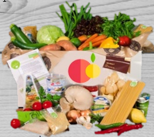
Lunchbox original € 33,84 (excl. BTW) VBO 001

De Original box bevat alle ingrediënten voor 5 gevarieerde maaltijden. De box bevat recepten voor vlees-, vis- en vegetarische gerechten.