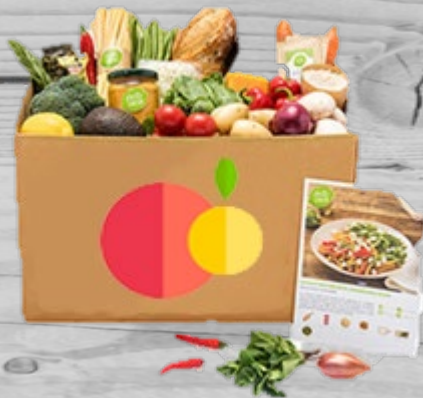
Lunchbox pasta € 31,96 (excl. BTW) VBP 002

De Original box bevat alle ingrediënten voor 5 gevarieerde maaltijden. De box bevat recepten voor vlees-, vis- en vegetarische gerechten.