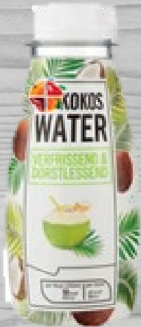
Coconut water € 0,67 (excl. VAT)