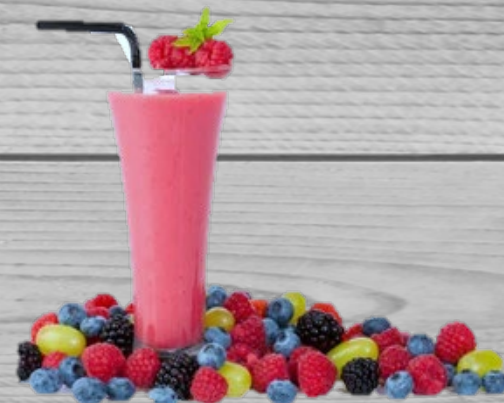
Smoothie Mix € 4,00 (excl. BTW) SMX 051

Hydratatie is belangrijk voor het lichaam. Door onze lekkere smoothies en kokoswater te drinken, zal u uw hydratatie de hele dag op peil kunnen houden