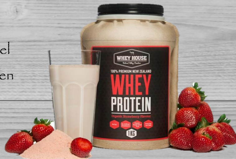
Protein strawberry shakes € 35,00 (excl. VAT) PSA 054