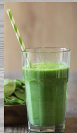
Smoothie Spinazie € 4,00 (excl. BTW) SMS 049