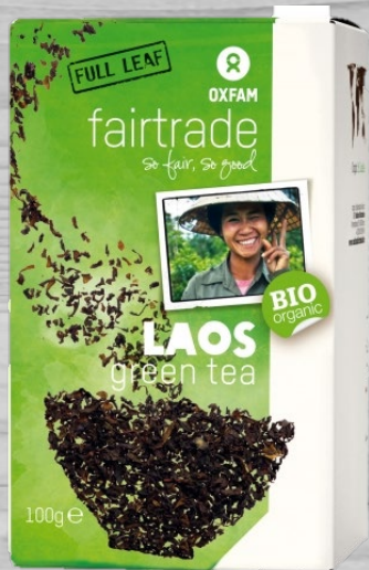
Oxfam losse groene thee € 5,42 (excl. BTW) OGT 032