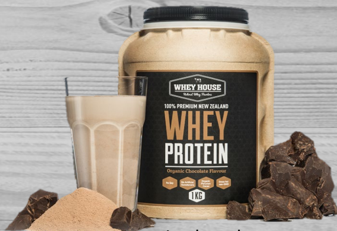
Protein chocolate shakes € 35,00 (excl. VAT) PSC 056