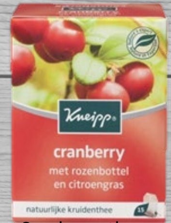
Cranberry tea € 4,70 (excl. VAT) OTI 034