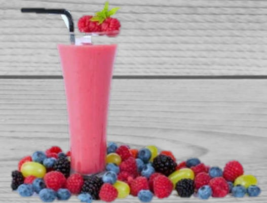
Smoothie Mix € 4,00 (excl. VAT)

Hydration is important for your body. If you want to stay hydrated through the whole day we suggest you drink this!