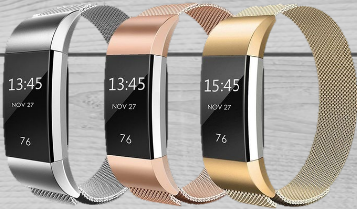
Fitbit € 120,00 (excl. BTW) FB 047

Activity trackers van Fitbit om uw dagelijkse bewegingen te registreren.