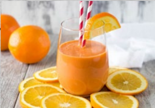
Smoothie Orange € 4,00 (excl. VAT)